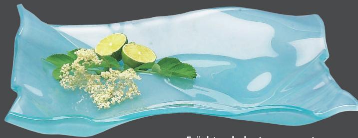
Früchteschale, transparent, 40 x 36 cm, Höhe 6 cm